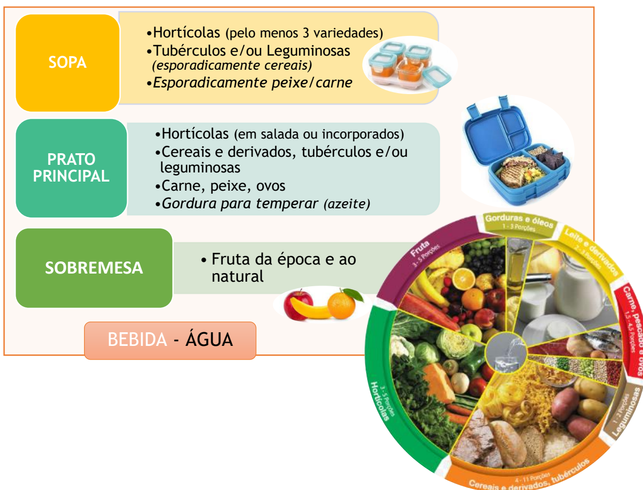
Quadro 3 - Constituição do almoço saudável

De acordo com os grupos alimentares da Roda dos Alimentos Portuguesa e as necessidades nutricionais da faixa etária alvo, a constituição de um almoço adequado deve seguir o preconizado no Quadro 3 .